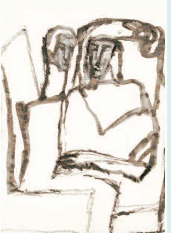
Basta restare: eccoli quelli che sanno stare vicino a colui che soffre (M. M. Poncet)