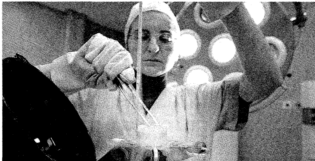
La legge 40 è da riscrivere, ha twittato ieri il senatore Ignazio Marino (foto a sinistra)