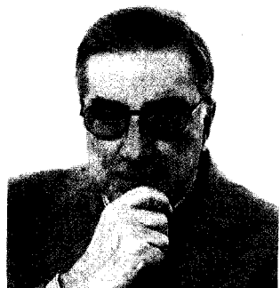
Presidente. Ugo Garbarini, Ordine dei medici di Milano

A rischio. I tagli imposti al sistema sanitario minacciano anche i medici ospedalieri. «Oggi prevale il precariato: i servizi di pronto soccorso dei grandi ospedali funzionano con medici pagati a gettone orario per pochi euro all'ora – commenta Ugo Garbarini, presidente dell'Ordine dei Medici di Milano –. Tra concorsi bloccati, assunzioni bloccate e mancanza di turn over fra qualche anno non avremo più medici