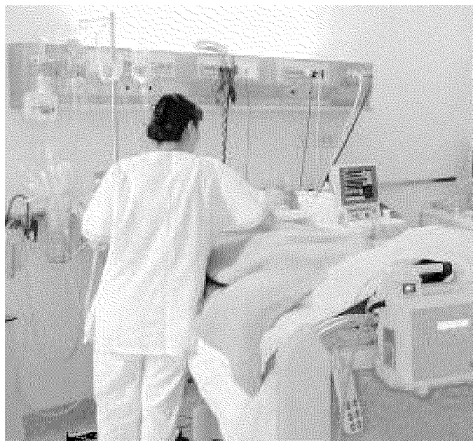
Un reparto di rianimazione