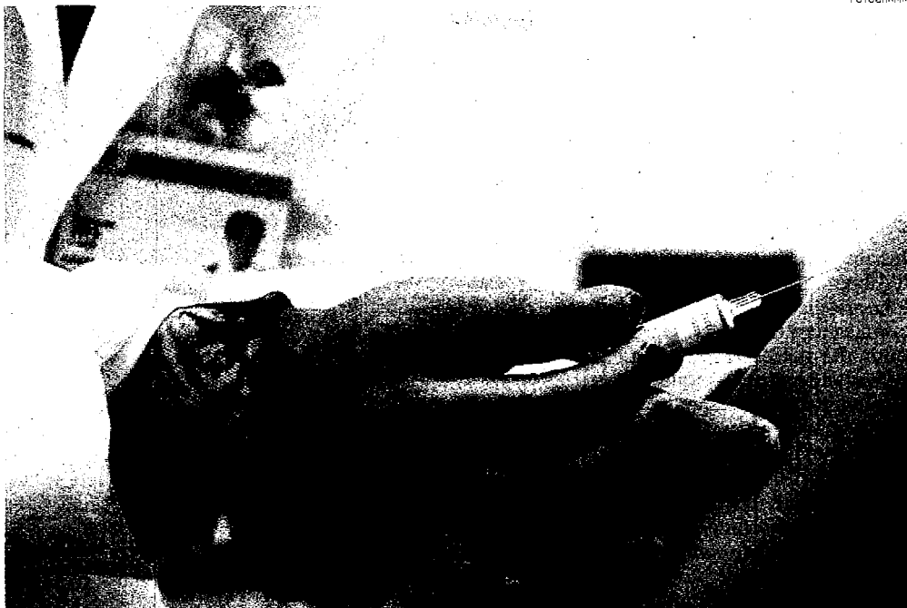
Vaccinazioni in corso. Nella Asl milanese di via Statuto il 2 novembre, primo giorno di profilassi contro l'H1N1